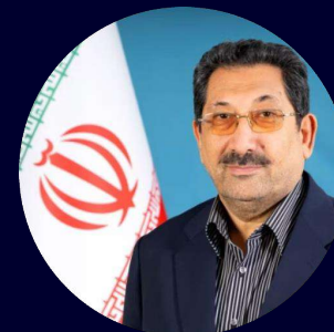
Министр промышленности, торговли и горной промышленности Исламской Республики Иран Сайед Мохаммад Аттабак

Важным направлением взаимодействия с Ираном является развитие торговых связей на евразийском пространстве, и выставка является отличным инструментом для достижения этой цели.