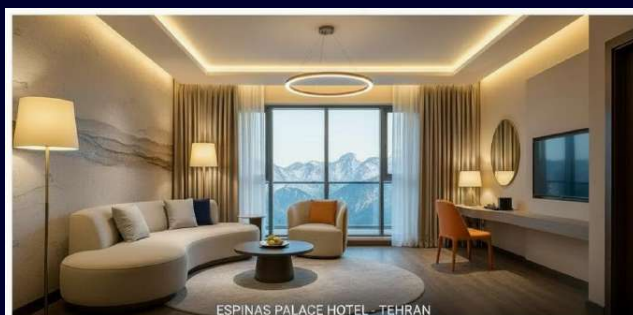
ESPINAS PALACE HOTEL - TEHRAN

Элитный отель, оборудованный по последнему слову техники, пребывание в котором позволит превратить в отдых даже рабочие