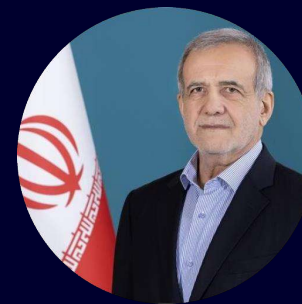
Президент Исламской Республики Иран Масуд Пезешкиан

Проведение совместной выставки (Выставка Евразия с 4 по 7 декабря 2023 года) в Тегеране, свидетельствует о сильном интересе российских компаний к установлению более плодотворных экономических и торговых отношений между двумя странами