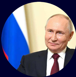
Президент Российской Федерации Владимир Владимирович Путин

Проведение совместной выставки (Выставка Евразия с 4 по 7 декабря 2023 года) в Тегеране, свидетельствует о сильном интересе российских компаний к установлению более плодотворных экономических и торговых отношений между двумя странами