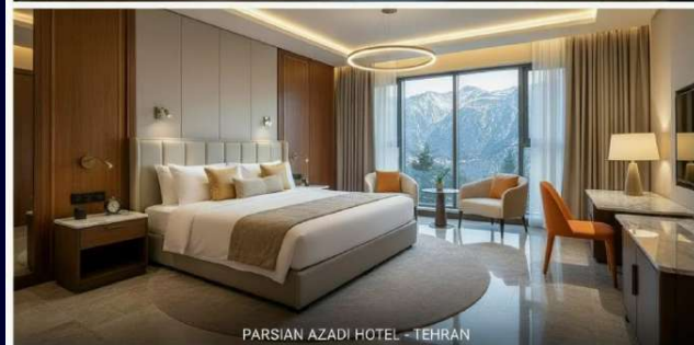
PARSIAN AZADI HOTEL - TEHRAN

Расположенные поблизости достопримечательности, такие как Darakeh (2,9 км) и Tehran International Exhibition (4,5 км), превращают отель Espinas Palace Hotel в отличное место пребывания для гостей Тегерана.