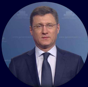
Заместитель Председателя Правительства Российской Федерации Александр Валентинович Новак

Иран может стать эффективной платформой для раскрытия потенциала стран Евразии в области торгового обмена и экономического развития. Посредством совместных инвестиций в различные экономические сферы мы можем не только способствовать росту экономического благосостояния, но и вносить вклад в Укрепление двусторонних отношений.