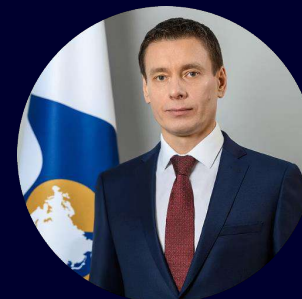
Член Коллегии (Министр) по торговле, Евразийская экономическая комиссия Слепнев Андрей Александрович

Убежден, что выставка EURASIA Expo в Тегеране станет центром притяжения гостей и участников, а многоформатное сотрудничество двух стран станет темой для продуктивного диалога на площадках деловых мероприятий при участии Фонда Росконгресс, которые состоятся в России и в Иране в 2025 году.